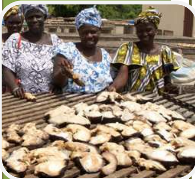
Séchage du yett (cymbium) par les membres de l'Association des Femmes transformatrices de Pointe Sarène (AFET)