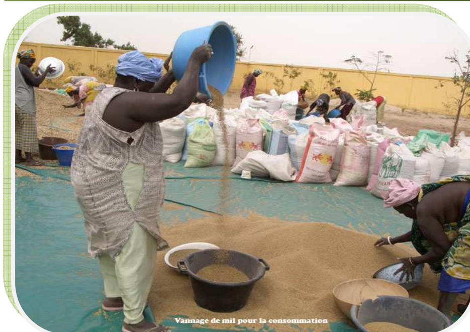
Vannage de mil pour la consommation

Vannage de mil pour la consommation à la COOPAM par les femmes membres de la coopérative