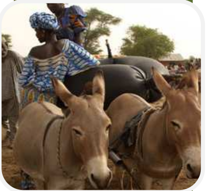
Recherche, transport et conservation d'eau dans des chambres à air par les femmes à Ndioum