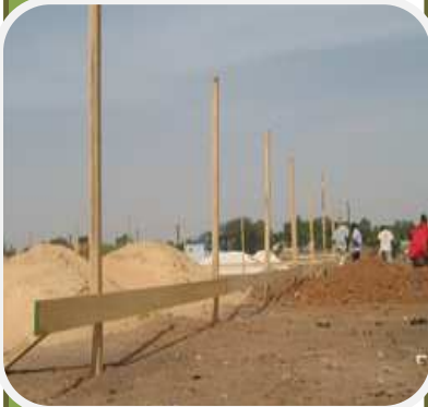
Début des travaux de la construction du siège du RESOPP à Thiès