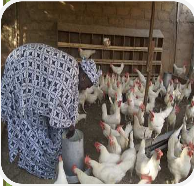
Projet spécial de poulailler dans la zone de Louga