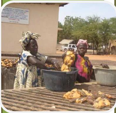
Traitement et ensoleillement de cymbium (PADER-Mbour)