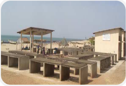
Aménagement de clais de séchage pour les femmes de Pointe Sarène