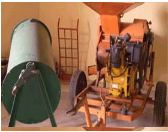
Mélangeur (traitement de semence sans risque d'intoxication)

Mais le mérite le plus important à mes yeux du PADER est d'avoir grandement contribué à réhabiliter le mouvement coopératif qui a été à tort considéré comme lié à l'idéologie socialiste. Il a fallu beaucoup de temps pour convaincre nos partenaires que les coopératives existent aussi en grand nombre aux Etats-Unis, au Canada, l'Union Européenne et dans bien d'autres lieux dans le monde.