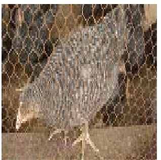
Race de poulets: bleu d'Hollande

Démarrée au PADER-Louga avec la COOPAKEL (Coopérative agricole de Kéle Guèye) en 2002, la construction de poulaillers au niveau des coopératives a facilité l'introduction de volailles améliorées (Bleu de Hollande) qui a beaucoup contribué à l'augmentation des revenus des coopérateurs - surtout pour les femmes - et à l'amélioration de l'alimentation des enfants (œufs).