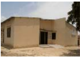
Complexe de santé de Mboulème (Mbour)