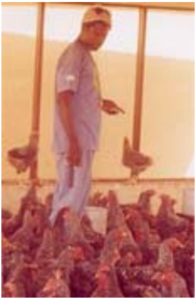
Poulailler dans nos coopératives