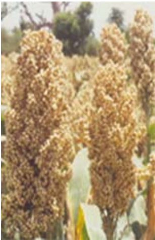
Variété de sorgho vulgarisé par le PADER