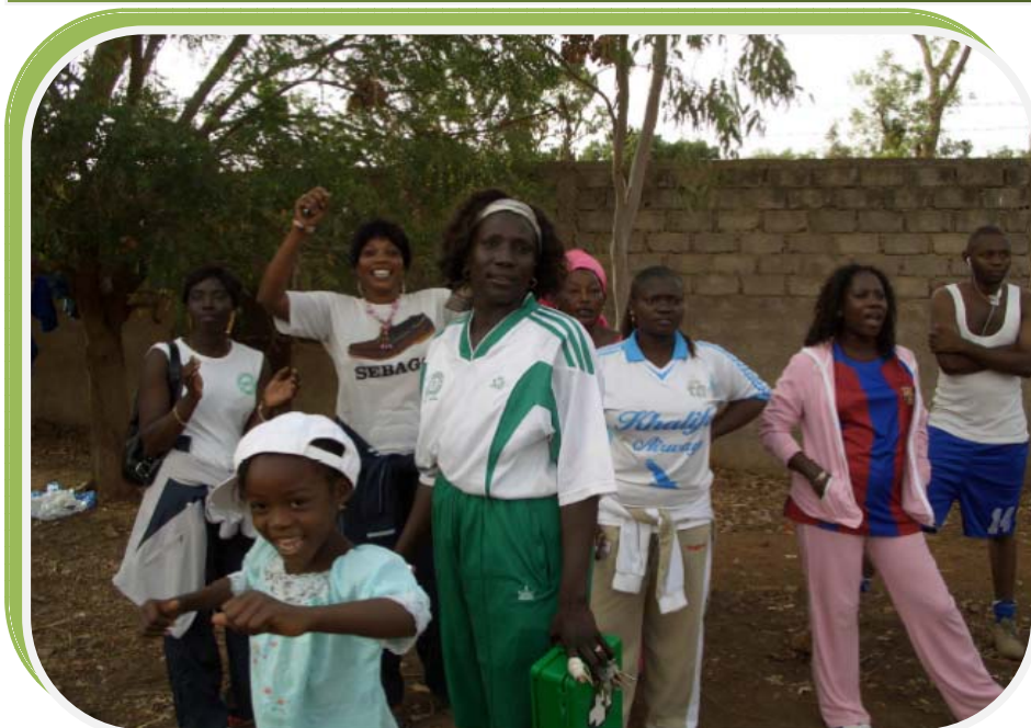
Moments de joie lors du match de football PADER-PROM'ART du 21 Juin 2007 (Victoire du PADER 2 buts à 1)