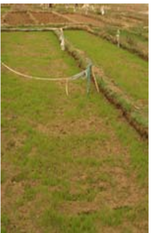
Riz irrigué à P. Gallo (Ndioum)