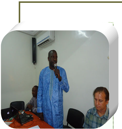
Directeur du RESOPP magnifiant l'apport du Projet

J'ai aussi pu gagner des cadeaux avec ces émissions. J'ai gagné un poste radio avec une clé USB où mon intervention a été enregistrée et d'autres producteurs ont témoigné à la radio avoir gagné quelque chose »