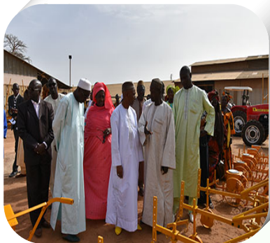
L'ensemble du matériel offert au RESOPP

Le Ministère de l'Agriculture et de l'Équipement Rural (MAER) via le WAAPP/PPAO (Programme de Productivité en Afrique de l'Ouest, financement Banque Mondiale) a procédé à la remise de matériels agricoles aux organisations paysannes du Sénégal dans les locaux de SISMAR (POUT).