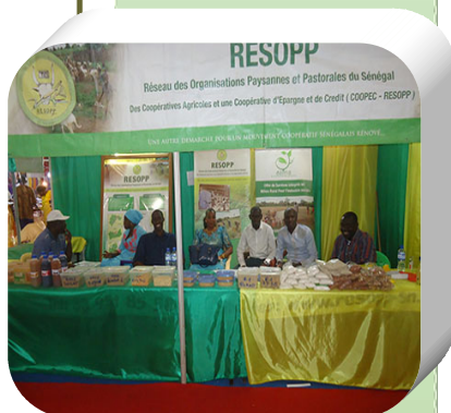
Stand du RESOPP (FIARA 2018)