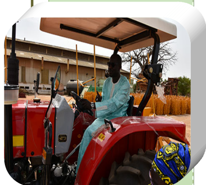
Le Directeur du RESOPP sur le tracteur offert