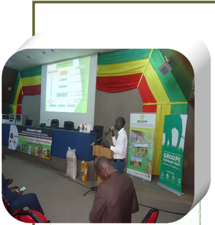
Conférence du RESOPP (FIARA 2018)

Le Réseau des Organisations Paysannes et Pastorales du Sénégal (RESOPP) a participé à la Foire Internationale de l'Agriculture et des Ressources Animales (FIARA) qui s'est tenue au Centre International du Commerce Extérieur (CICES) de Dakar. Comme à l'accoutumée, une équipe constituée du responsable de la communication et de la chargée de la commercialisation a été envoyée et a séjourné à Dakar du 29 mars au 12 avril 2018.