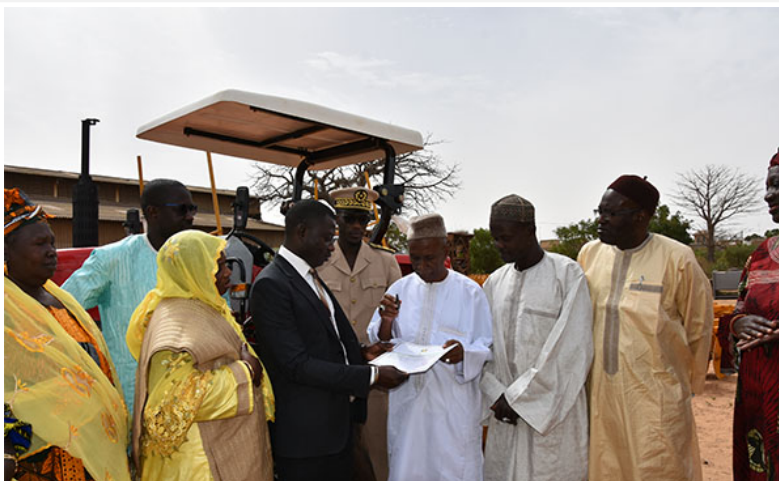
Remise officielle du lot de matériels agricoles au PCA du RESOPP par LE Ministre Délégué Chargé des Organisations des Paysannes