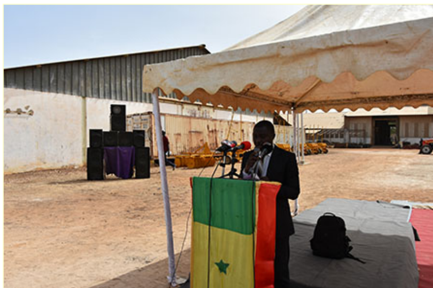
Le Ministre magnifiant l'appui constant du Gouvernement aux Organisations de producteurs.