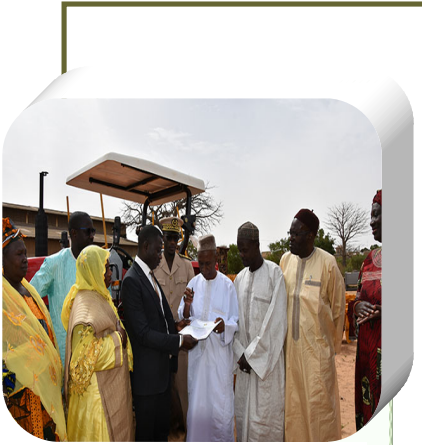
Remise clé au PCA du RESOPP