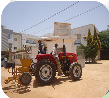
Arrivée du tracteur au RESOPP

De l'avis des élus du RESOPP, ce lot de matériels vient consolider et magnifier le travail du RESOPP et surtout montré l'importance que les Autorités étatiques accordent aux activités de terrain de notre organisation.