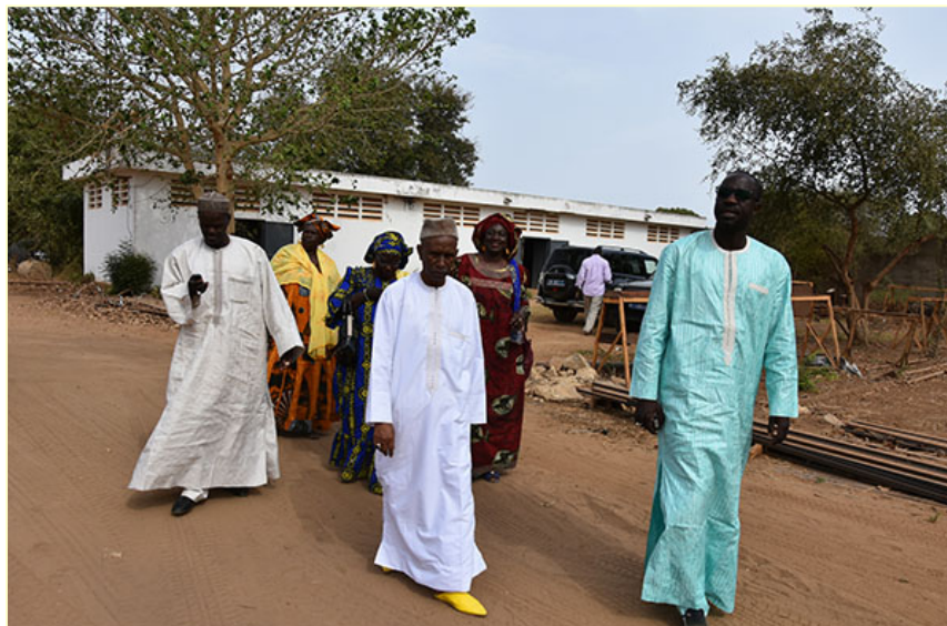
Arrivée de la délégation du RESOPP